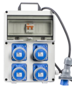
VB-PL220/4/SP - € 141,80 Quadro elettrico 4 prese 2P+T 16A 230V IP67 Presca SCHUKO PRO 10/16A Int. diff. mt 16 A - 3Kw