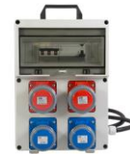
VB-PL380/2/2 - € 187,00 Quadro elettrico 4 prese 2x 2P+T 16A 230V IP67 2x 3P+T 16A 400V IP67 Spina 3P+N+T 16A 400V IP67 Diff. Puro 25 A - 9 Kw