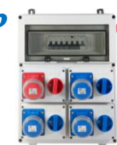
VB-PLG31000 € 374,00 Quadro elettrico 4 prese interbloccate 3x 2P+T 16A 230V IP67 1x 3P+T 16A 400V IP67 Diff. Gen. 40 A - 18 Kw Con Pulsante d'emergenza Alimentazione Morsettiera interna