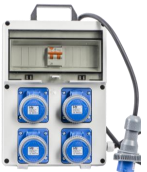
VB-PL220/4-MCH - € 163,00 Quadro elettrico 4 prese 3 Kw IP67 N° 4 magnetotermici IP+N