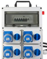
VB-PLG40000-4M-CS € 334,00 Quadro elettrico 4 prese interbloccate 2P+T 16A 230V IP67 Diff. Gen. 40 A - 3 Kw N° 4 magnetotermici IP+N Con Pulsante d'emergenza Alimentazione Spina 2P+T 16A 230V IP67