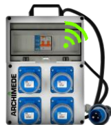
VB-PL220/4/A - € 144,40 Quadro elettrico portatile 4 prese 2P+T 16 A 230V IP67 Int. diff. MT 16 A - 3Kw - Con sistema di sicurezza ARCHIMEDE