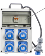
VB-PL220/4-F - € 162,60 Quadro elettrico 4 prese 3KW IP67 Con Pulsante Emergenza