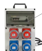
VB-PL380/2/2-F € 251,00 Quadro elettrico 4 prese 2x 2P+T 16A 230V IP67 2x 3P+T 16A 400V IP67 Spina 3P+N+T 16A 400V IP67 Diff. Puro 25 A - 9 Kw Con Pulsante Emergenza