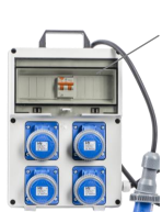
VB-PL220/4-F-SP - € 171,80 Quadro elettrico 4 prese 2P+T 16A 230V IP67 Presca SCHUKO PRO 10/16A Int. diff. mt 16 A - 3Kw Con pulsante d'emergenza