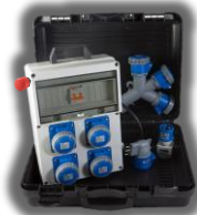
NOVITA Con Pulsante d'emergenza VB-BL01-F € 234,00 KIT VALIGETTA Quadro : VB-PL220/4-F Moltiplicatore : VB-1452 Adattatori : VB-73100 + VB-73000