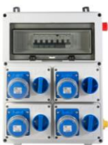
VB-PLG40000-4M € 314,00 Quadro elettrico 4 prese interbloccate 2P+T 16A 230V IP67 Diff. Gen. 40 A - 9 Kw N° 4 magnetotermici IP+N Con Pulsante d'emergenza Alimentazione Morsettiera interna