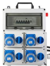
VB-PLG40000-2M-CS € 316,00 Quadro elettrico 4 prese interbloccate 2P+T 16A 230V IP67 Diff. Gen. 40 A - 3 Kw N° 2 magnetotermici IP+N Con Pulsante d'emergenza Alimentazione Spina 2P+T 16A 230V IP67