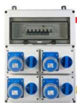
VB-PLG40000-2M € 296,00 Quadro elettrico 4 prese interbloccate 2P+T 16A 230V IP67 Diff. Gen. 40 A - 9 Kw N° 2 magnetotermici IP+N Con Pulsante d'emergenza Alimentazione Morsettiera interna