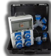
VB-BL01 - € 203,00 KIT VALIGETTA Quadro : VB-PL220/4 Moltiplicatore : VB-1452 Adattatori : VB-73100 + VB-73000