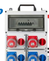
VB-PLG22000-CS € 394,00 Quadro elettrico 4 prese interbloccate 2x 2P+T 16A 230V IP67 2x 3P+T 16A 400V IP67 Diff. Gen. 25 A - 9 Kw Con Pulsante d'emergenza Alimentazione Spina 3P+N+T 16A 400V IP67